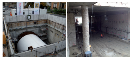
Verkehrsprojekt Kombilösung, Karlsruhe.