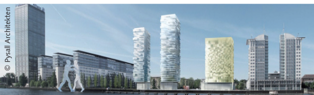
Hotel und Wohnen an der Spree, Berlin-Treptow.